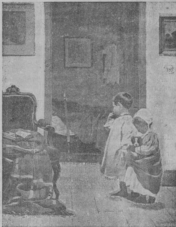
ALFREDO SOUTO CUERO.—Copia del cuadro "Huérfanos"

Y esta escena tan particular de las mujeres de Pedregás , se prolongaba hasta despuntar el sol de la mañana de San Juan, de ese sol que baila en la aurora de semejante día, según la creencia del pueblo galiciano; pero en tanto que todo esto pasaba, se dejaba oír la música deliciosa del aludido rey moro , tal vez con el perverso objeto de fascinar y atraer á alguna de aquellas vírgenes que, presentando desnudo el pecho, miraban á la bóveda celeste, proceder —y dispéñeme el rey moro — que me parece una gran picardía, ó tal vez con la inocente idea de tocar el arpa ó el violín, por pure pasatiempo, no pensando así en las largas y tristes horas de su encantamiento y de su prisión. El caso es que no hay memoria de que aquellas vírgenes, aún cuando hayan oído la música, hubiesen resbalado lo más mínimo, teniendo con esto la suerte de escuchar melodías en su es-