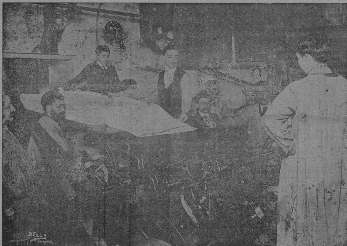
CORUÑA.-Talleres de "La Voz de Galicia"