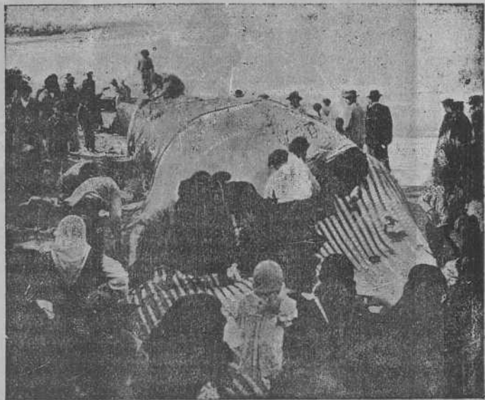
VIGO.—Una ballena en la playa de San Gregorio