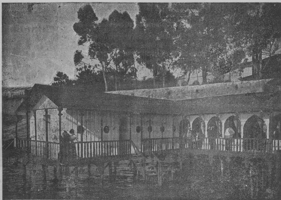
VIGO.-Interior de la Casa de baños de Beneficencia.